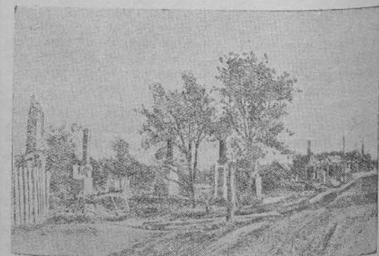
Вид одной из улиц поселка Западной Белоруссии после краткого временного хозяйничанья гитлеровских бандитов