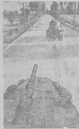
Разведывательный отряд бронемашин